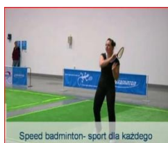
Speed badminton- sport dla każdego