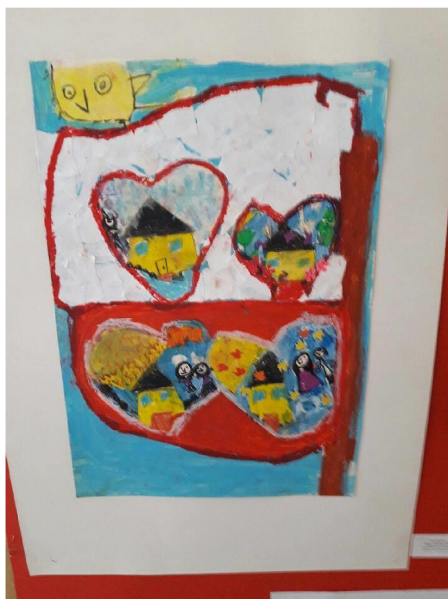
autorka – Maja Tynecka kl. 0 „b”