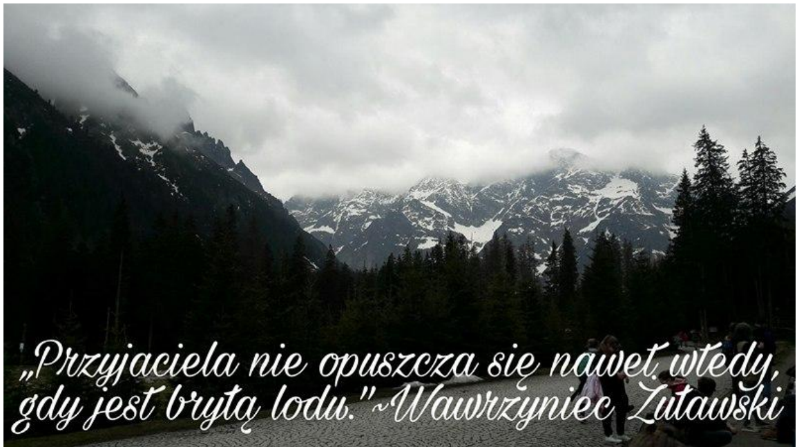
Fot. Julia Worobiej kl. IIIc